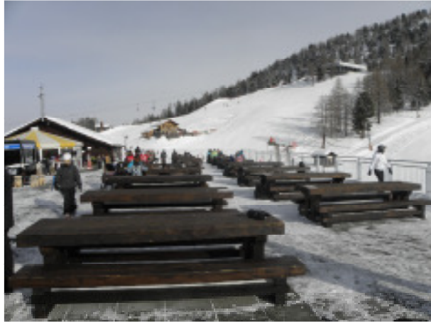
Sonnenterrasse mit Holztischen und -bänken