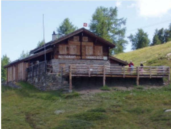
Aussenansicht Sommer Süd