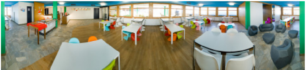
Mäc Sisu Panoramaansicht