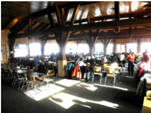
Hannigrestaurant Innenansicht Ost