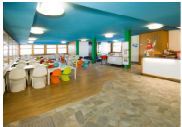
Mäc Sisu Innenansicht