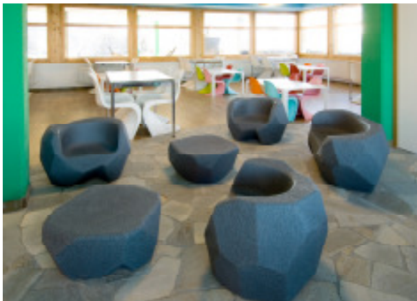
Mäc Sisu Kindersitzecke