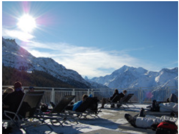
Sonnenterrasse mit Liegestühlen