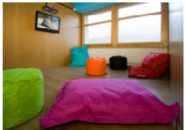
Mäc Sisu Kinderkino