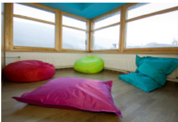
Mäc Sisu Kinder Relaxzone