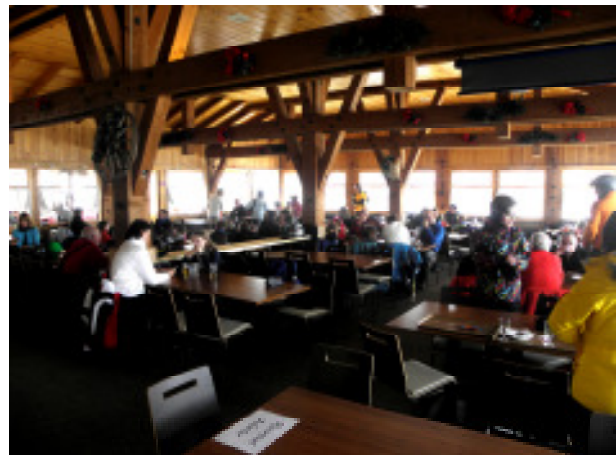
Hannigrestaurant Innenansicht West